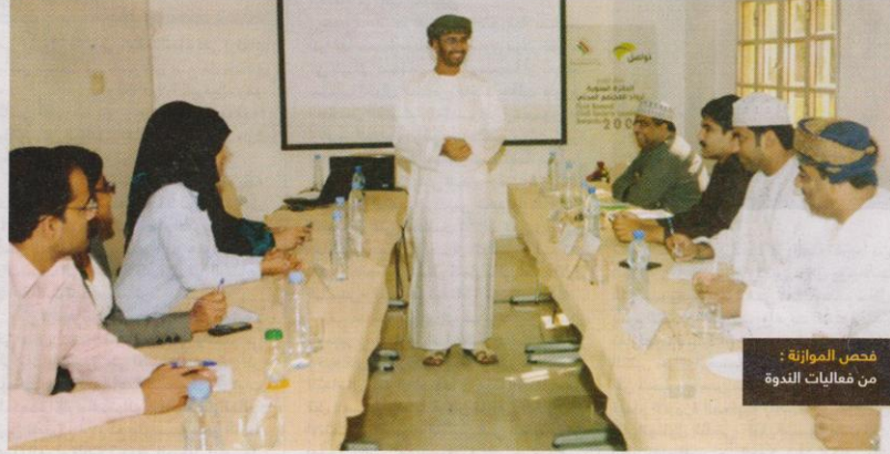
فحص الموازنة : من فعاليات الندوة

قدرات المجتمع المدني أو الأنشطة الإعلامية أو الأوراق البحثية حيث حققنا خلال العام من الفاتحين منذ انطلاقتنا تنفيذ أكثر من 35 برنامجاً تدريبياً استفاد منه ما يقارب 550 متدرباً مشيراً إلى أن الفعاليات تتنوع ما بين حلقات العمل والملقبات و الندوات والحلقات النقاشية والمؤتمرات الصحفية ولقاءات الطاولة المستديرة.