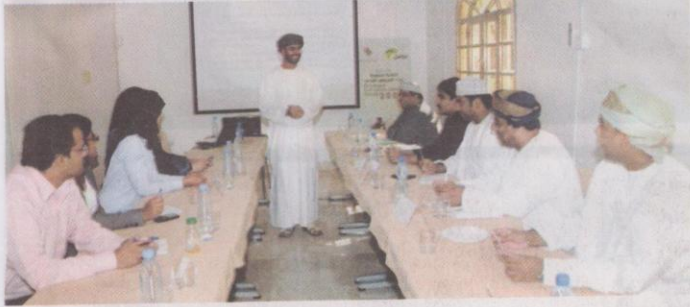
■ أثناء فعاليات الندوة