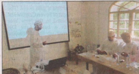
Hamad Al Musharraf addresses the media.

"The state budget has several short and long term implications. In the short