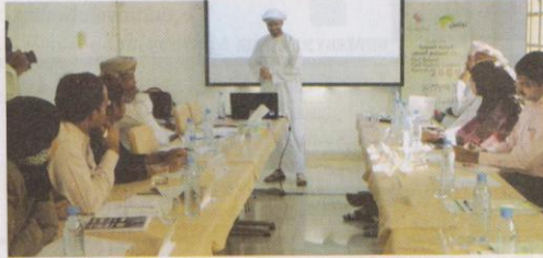
المحاضر يقدم شرحاً لعدد من الصحفيين عن أليات ومهارات فحص الموازنة

انطلقت صباح يوم أمس فعاليات ندوة "فحص الموازنة العامة للدولة" والتي تنظمها (تواصل العالمية) للاعلاميين والتي استهدفت مديري التحرير وروساء الأقسام الاقتصادية بالصحف والمجلات المحلية بجانب ممثلين من جمعية الصحفيين العمانية حيث تهدف الندوة إلى تزويد الاعلاميين باليات ومهارات فحص الموازنة