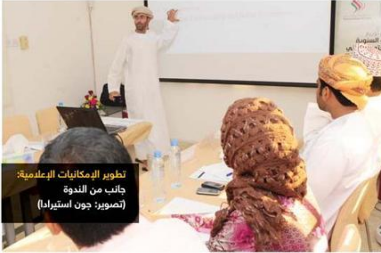
تطوير الإمكانيات الإعلامية: جانب من الندوة